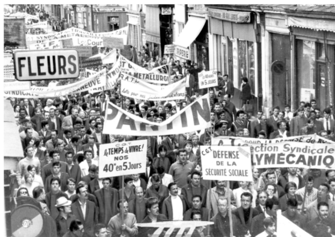
Manifestation à Aubervilliers, 24 mai 1968. L'Humanité – Droits réservés - Mémoires d'Humanité / Archives départementales de la Seine-Saint-Denis, 83Fi/172 139