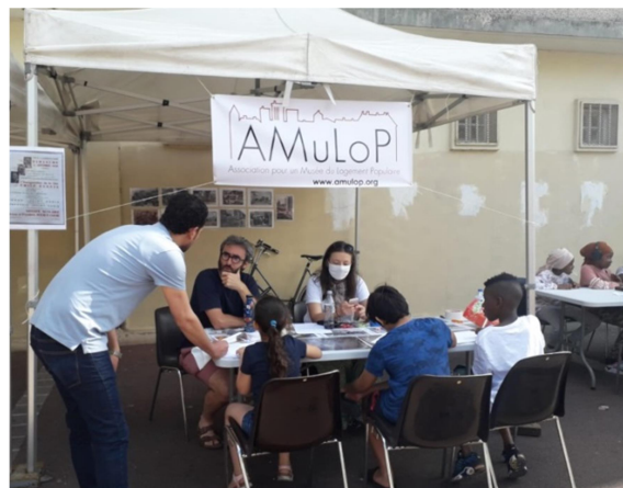
Atelier avec les habitant.e.s du quartier Émile-Dubois-Maladrerie, Aubervilliers, 2020

Il s'agit donc de construire une exposition ouverte à tous les publics et en particulier à ceux qui ne fréquentent pas ou peu les musées. Pour cela, l'AMuLoP souhaite mettre en place une scénographie immersive, relevant de l'expérience personnelle et propre à susciter l'émotion des publics, tout en présentant des reconstitutions rigoureuses scientifiquement et en assurant la transmission d'un discours historique exigeant.