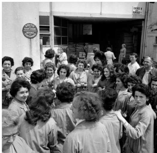
Groupe de femmes devant une entreprise à Aubervilliers, mai 1964. L'Humanité - Droits réservés – Mémoires d'Humanité / Archives départementales de la Seine-Saint-Denis, 97FI/642237