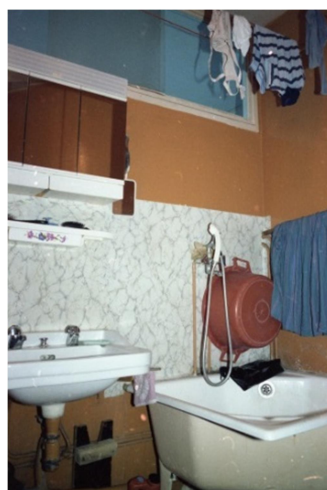
Vues intérieures de différents appartements de la cité Émile-Dubois, années 1980 – Patrice Lutier

Un premier logement sera reconstitué autour de la vie d'une famille ayant habité la barre Groperrin dans les années 1950-1960 , et le second autour d'une famille des années 1970-1980 . Les pièces seront reconstituées à partir de meubles, objets et décorations, dont certains prêtés par des témoins que l'AMuLoP a rencontrés. Les guides présenteront dans ces décors des archives écrites et audiovisuelles numérisées et vidéoprojetées, afin de redonner vie aux habitant.e.s du passé et de découvrir plus largement les habitant.e.s du territoire.