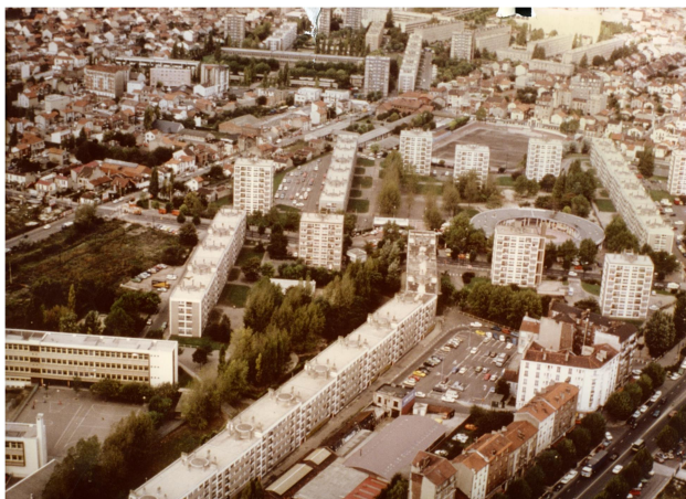
Vue aérienne de la cité Émile-Dubois, Aubervilliers [s.d.] Patrice Lutier

L'exposition aura lieu à quelques pas d'une future gare du Grand Paris Express, sur un territoire qui sera profondément transformé par la construction de 1800 logements (ZAC du secteur Fort d'Aubervilliers). Dans ce contexte, mettre en perspective l'histoire du quartier et la vie quotidienne de ses habitant.e.s est un enjeu crucial.