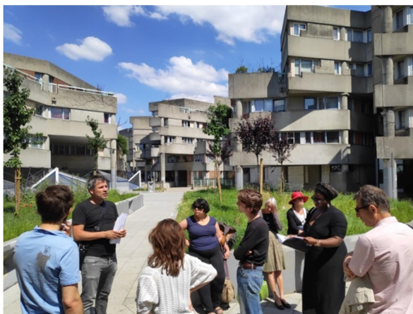
Balade-enquête « Qui habitait-là ? », Saint-Denis, 2019 - AMuLoP

Forte d'un nombre important d'enseignant.e.s parmi ses membres, l'AMuLoP souhaite s'adresser aux publics scolaires , depuis le primaire jusqu'à l'université. Des ateliers et outils pédagogiques seront proposés aux enseignant.e.s afin de préparer les visites de l'exposition et de pouvoir s'appuyer dessus dans la mise en œuvre des programmes scolaires. Enfin, le projet vise également les touristes régionaux, nationaux et internationaux, intéressé.e.s par une offre touristique atypique et sociale en plein développement.